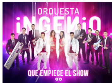
Viernes 29 de julio ORQUESTA INGENIO