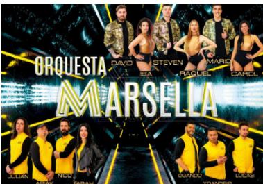
Jueves 28 de julio ORQUESTA MARSELLA