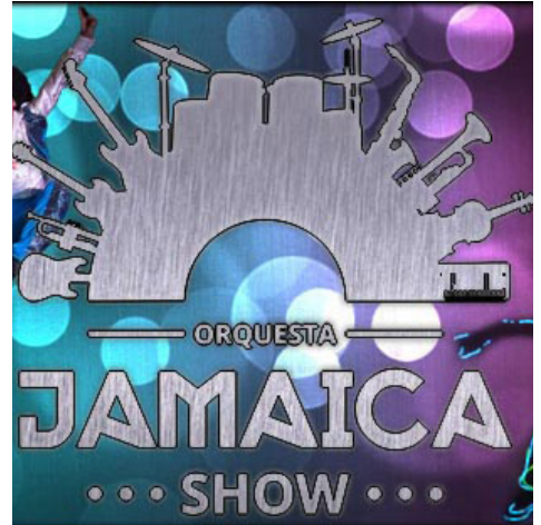
Lunes 25 de julio ORQUESTA JAMAICA SHOW