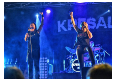
Sábado 30 de julio KRESALA