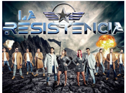
Miércoles 27 de julio LA RESISTENCIA