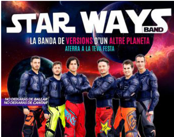
Domingo 24 de julio STAR WAYS