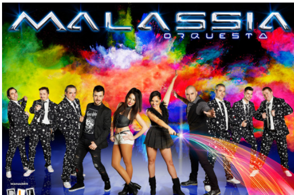
Martes 26 de julio MALASSIA ORQUESTA